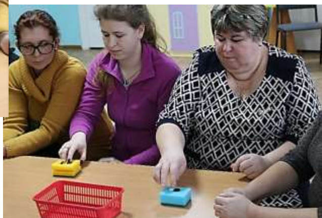
Игровое упражнение «ЛЫЖИ»