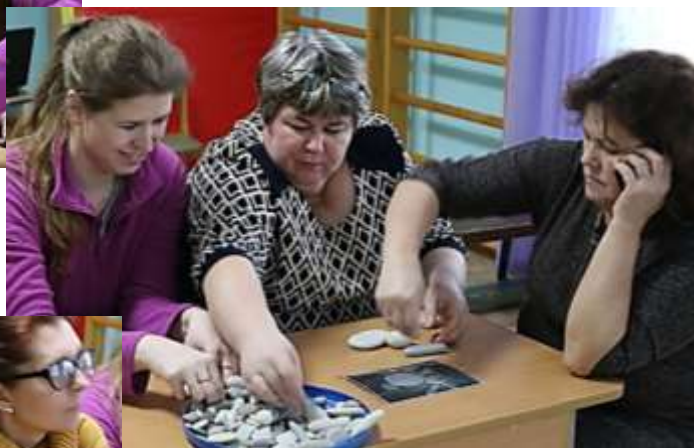
Игровое упражнение «ИГРА НА ПИАНИНО»