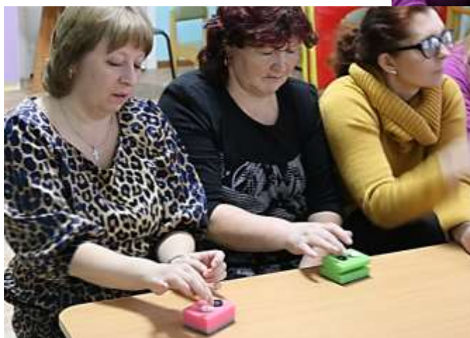
Игровое упражнение «СНЕЖОК»