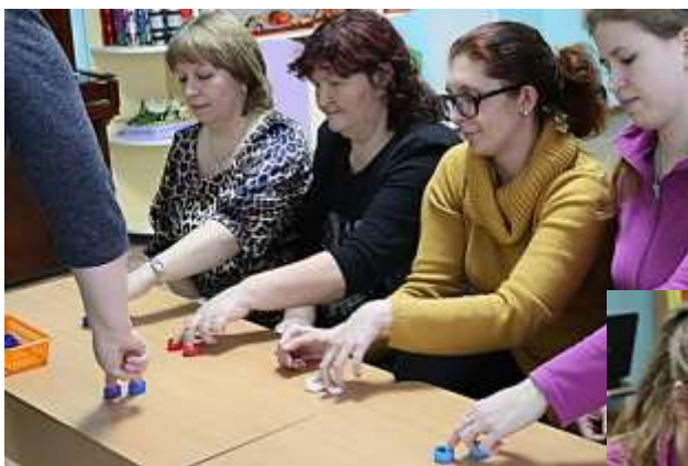
Игровое упражнение «ЛЫЖНИКИ»