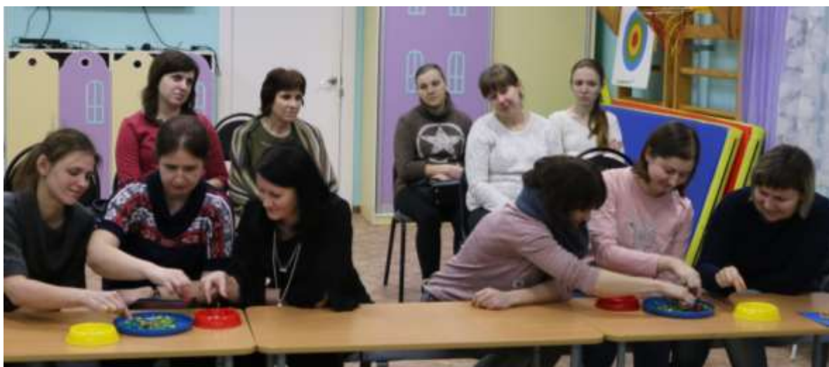
Игровое упражнение «СИЛАЧ»