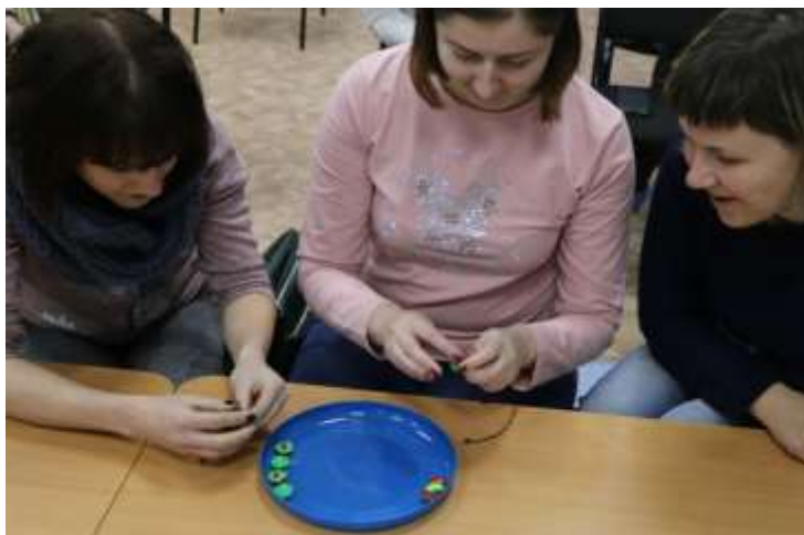
Игровое упражнение «СУШЕНЫЕ ЯБЛОКИ»