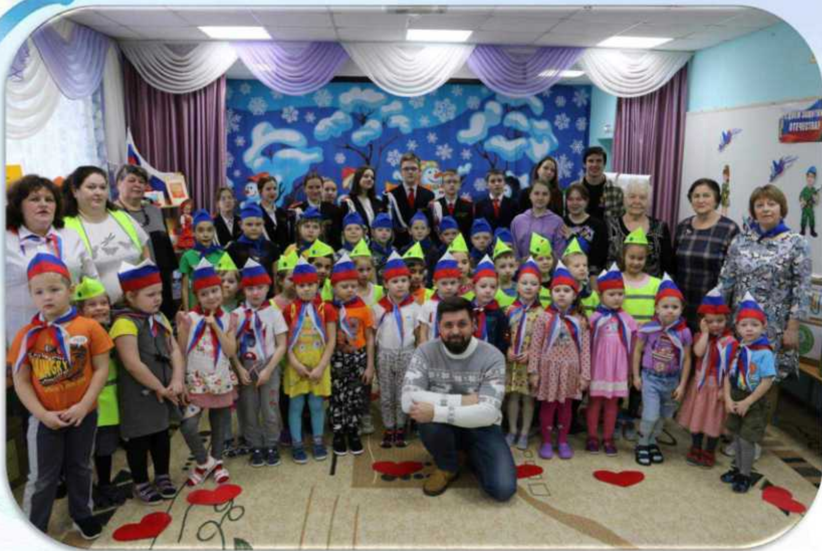
Акция «Посылка земляку»