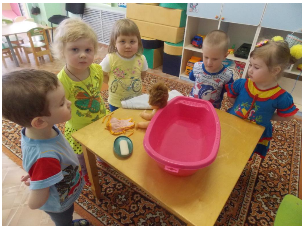
Купаем куклу Катю