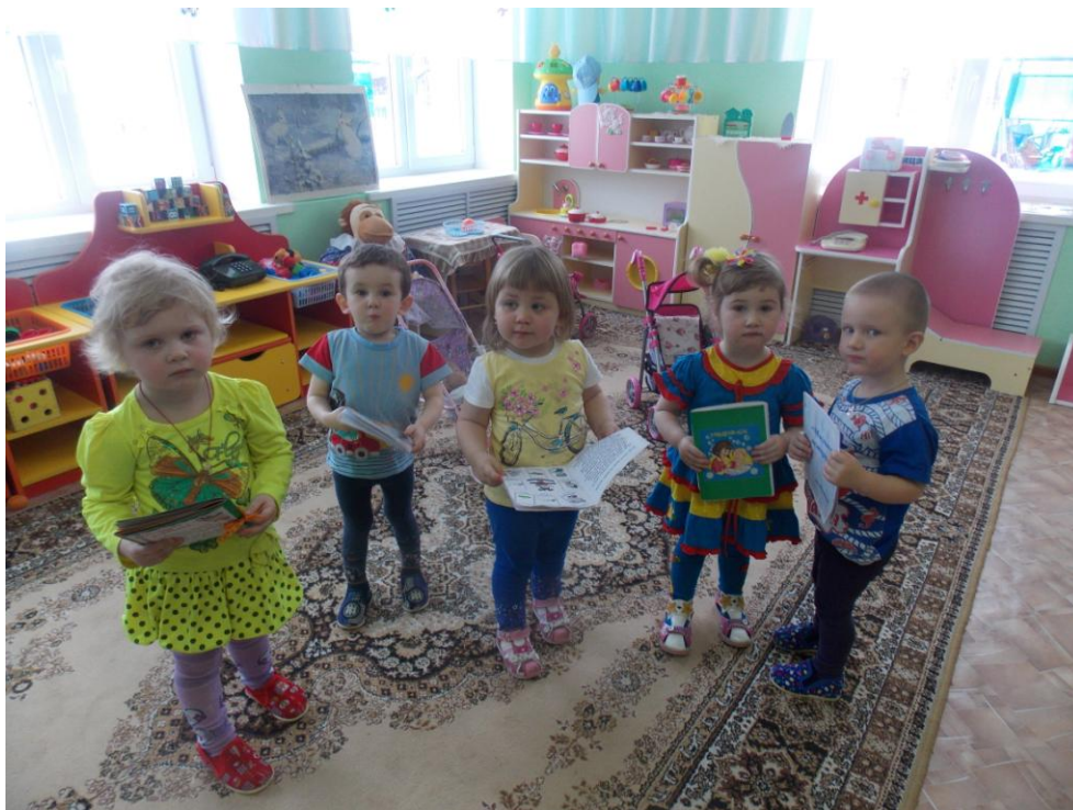
Книжки – малышки